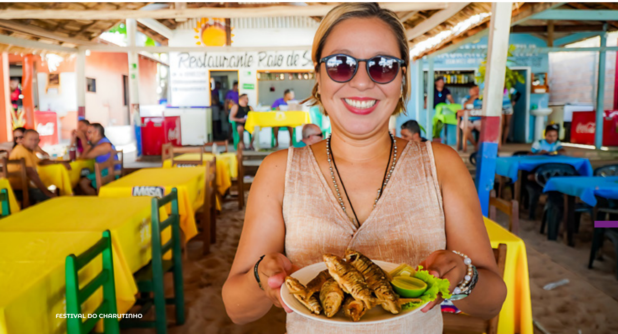
FESTIVAL DO CHARUTINHO

Apoiamos eventos esportivos internacionais que impulsionaram o turismo, como o San Beach Open realizado na Praia do Cajueiro, em Alter.