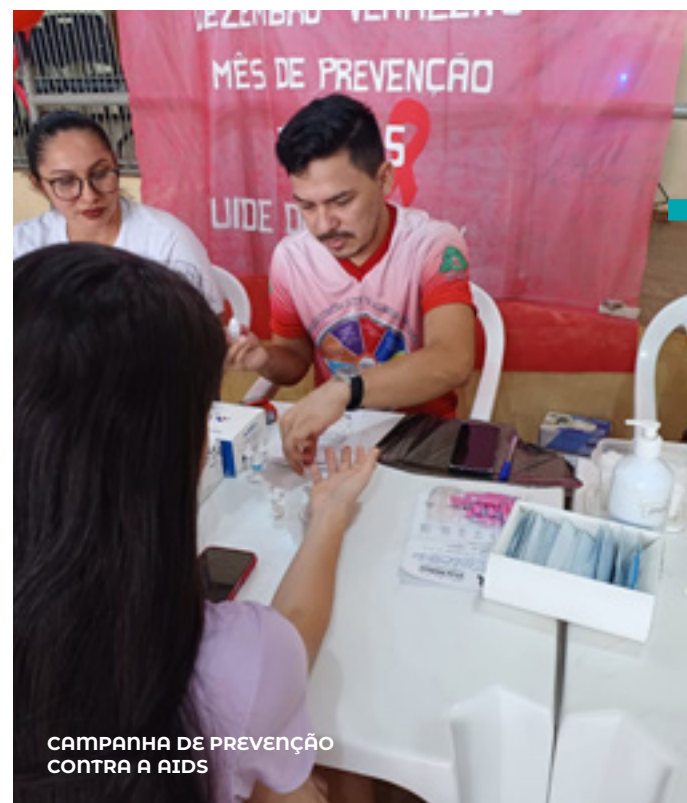
CAMPANHA DE PREVENÇÃO CONTRA A AÍDS

O Programa Saúde nas Escolas beneficiou 59.355 alunos em 13 temáticas durante o período letivo. E o Programa Saúde com Agente capacitou 190 Agentes Comunitários de Saúde e 39 Agentes de Combate a Endemias .