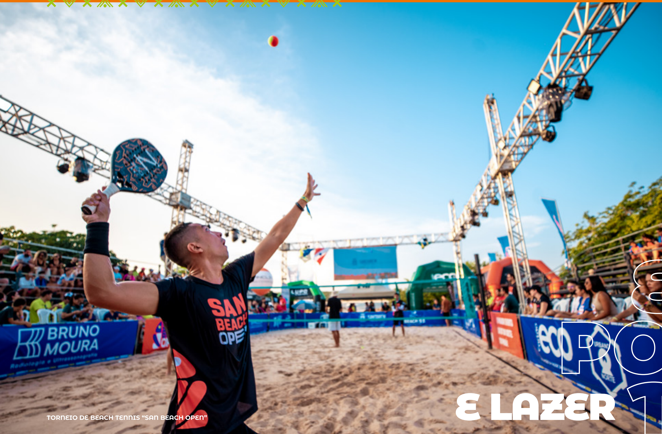
TORNEIO DE BEACH TENNIS "SAN BEACH OPEN"