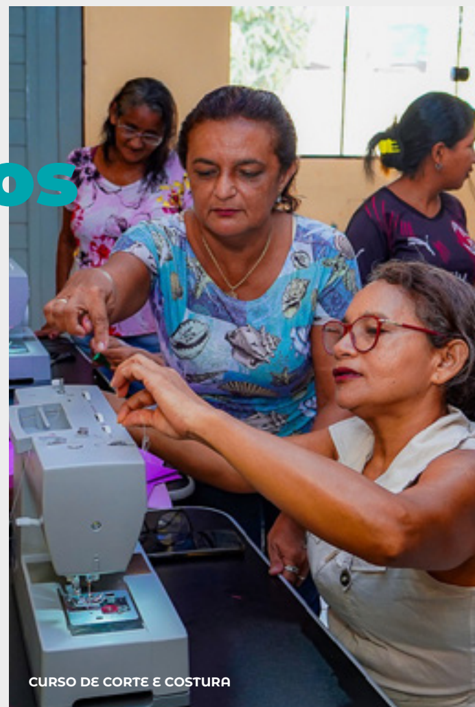
CURSO DE CORTE E COSTURA

Em 2023, a política de Assistência Social consolidada pela Prefeitura de Santarém, por meio da Secretaria Municipal de Trabalho e Assistência Social (SEMTRAS), registrou mais de 600 mil atendimentos à população em situação de vulnerabilidade social. Desses, 335 mil foram atendimentos pela Proteção Social Básica (PSB), envolvendo os 8 Centros de Referência de Assistência Social (CRAS), o Centro de Convivência do Idoso (CCI) e o Centro de Atendimento Social (CAS/CAEC).