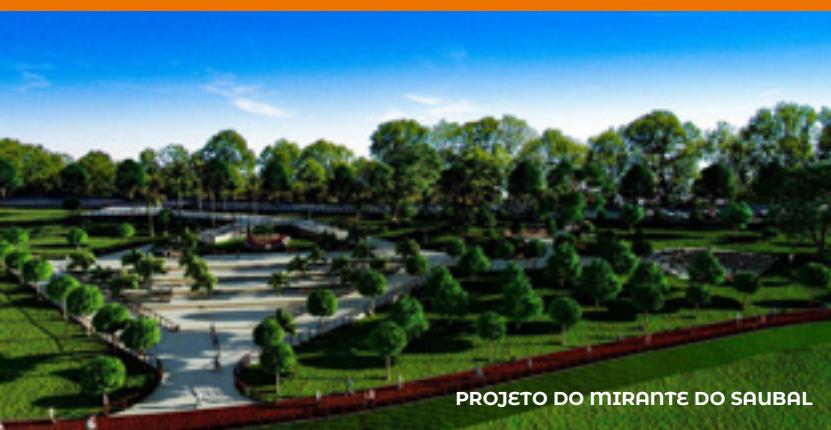
PROJETO DO MIRANTE DO SAUBAL

A implantação da rede de drenagem abrangeu mais de 95% das obras realizadas desde 2017, tornando Santarém a única cidade na região Oeste do Pará com mais de 100 km de drenagem profunda em toda a extensão urbana. De 2017 a 2023, foram implantados mais de 50 km de tubos para drenagem profunda. A previsão é entregar mais 20 km de redes e canais de águas pluviais subterrâneos em toda a cidade até o final de 2024.