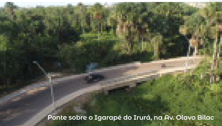
Ponte sobre o Igarapé do Irurá, na Av. Olavo Bilac