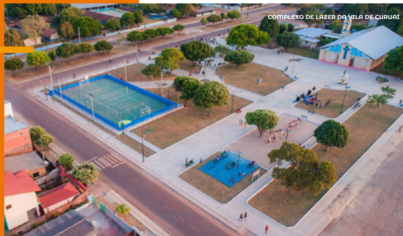
COMPLEXO DE LAZER DA VILA DE CURUAI