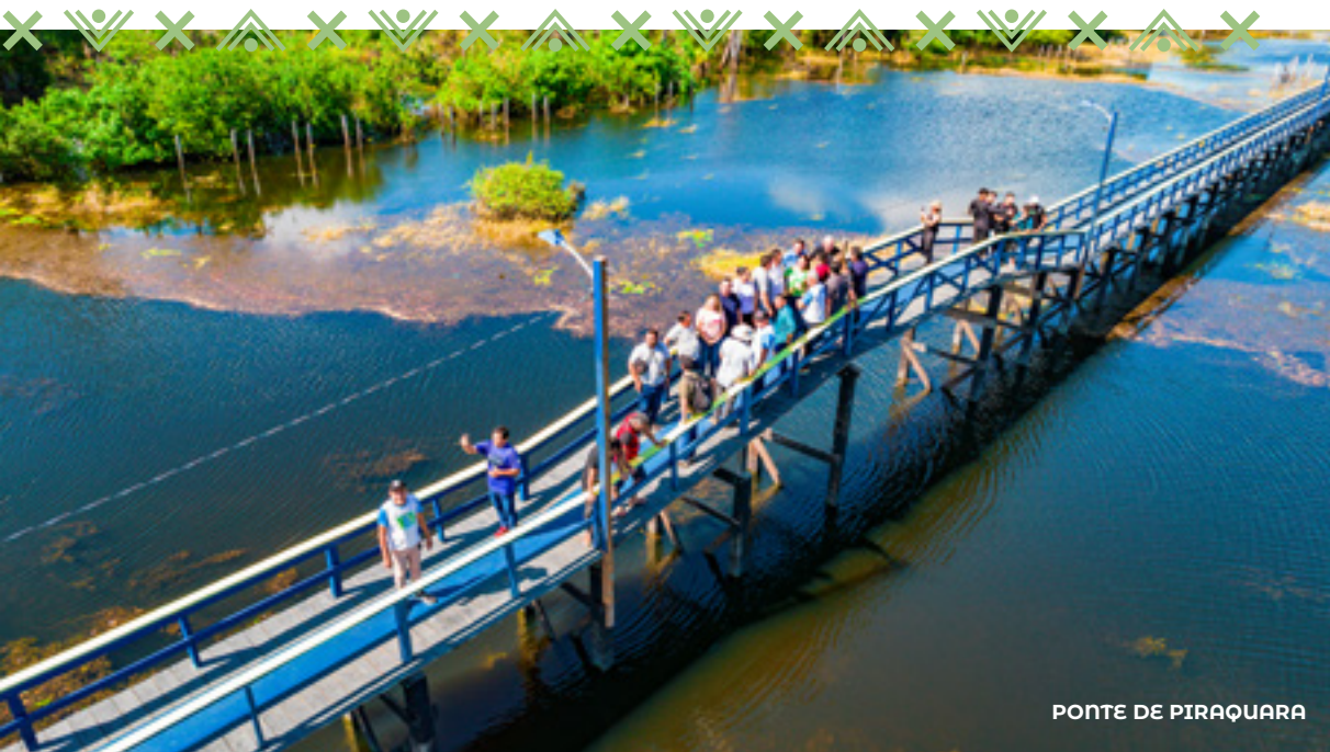
PONTE DE PIRAQUARA

Registrrou-se um aumento significativo no número de empresas cadastradas no Serviço de Inspeção Municipal (SIM) . Atualmente, 43 estabelecimentos possuem o selo municipal , sendo 30 empresas cadastradas no Serviço de Origem Animal (SIMPOA) e 13 no de Origem Vegetal (SIMPOV). Essa expansão representa um avanço importante na regulamentação e controle dos serviços no município.