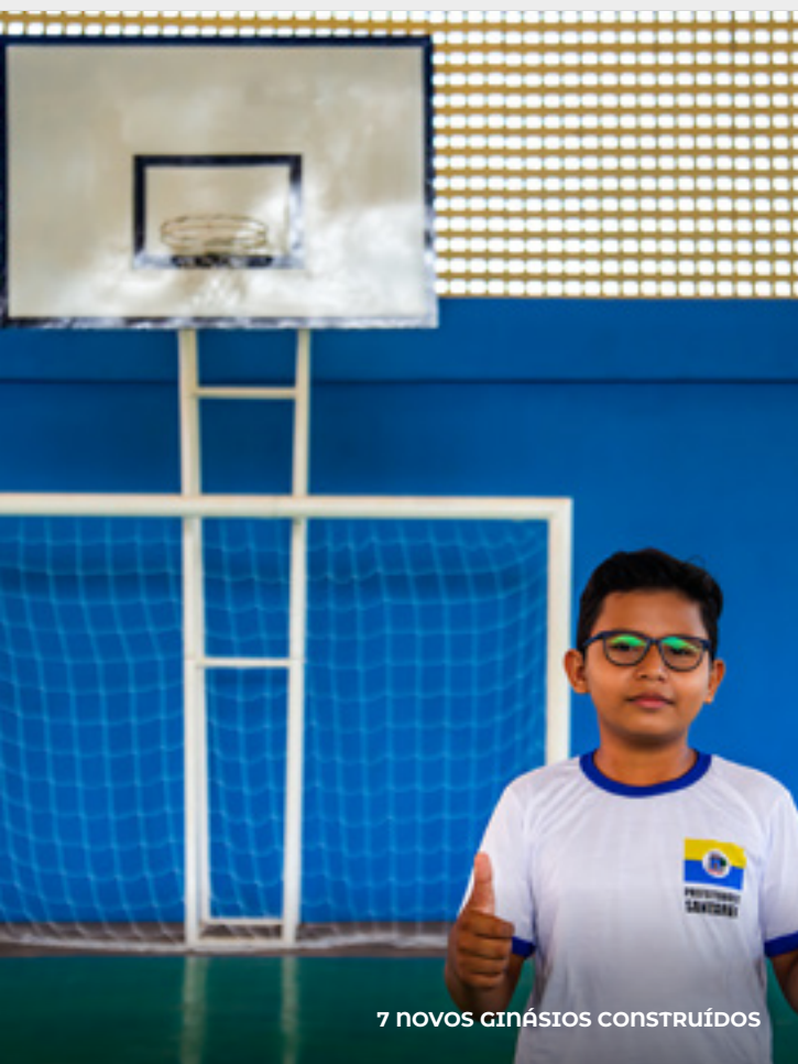
7 NOVOS GINÁSIOS CONSTRUÍDOS

Os investimentos em água potável de qualidade somam R$ 16.742.278,12 com perfuração de 52 poços em nossas escolas municipais.