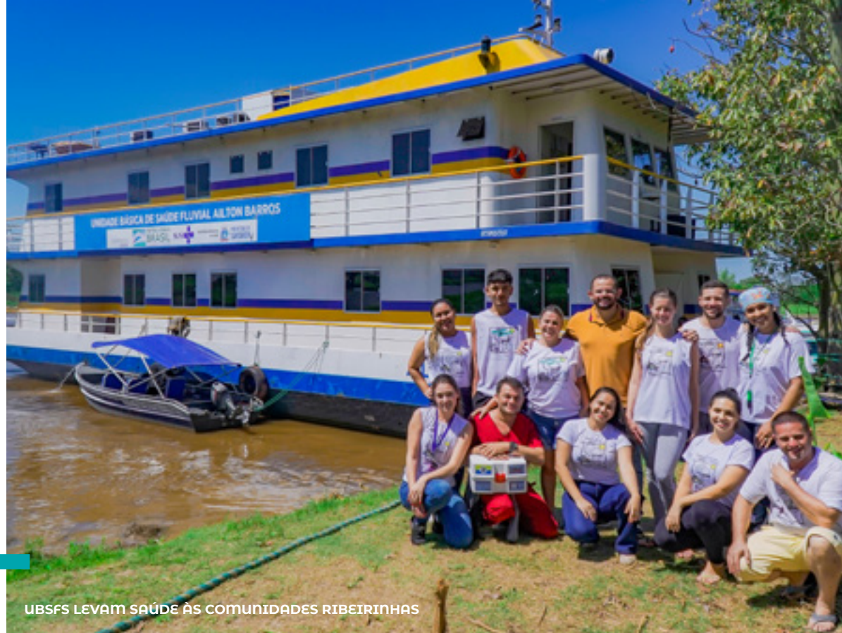
UBSFS LEVAM SAÚDE ÀS COMUNIDADES RIBEIRINHAS

Apesar dos desafios enfrentados devido à seca extrema , a saúde ribeirinha fortaleceu sua cobertura com projetos em homologação para transformar equipes de Saúde da Família em Saúde da Família Ribeirinha nas UBS : Tapará Grande, Antônio Evangelista e Vila Gorete. Essas mudanças visam expandir equipes, incluindo unidades satélites para áreas remotas, otimizando a atenção à saúde em comunidades distantes.