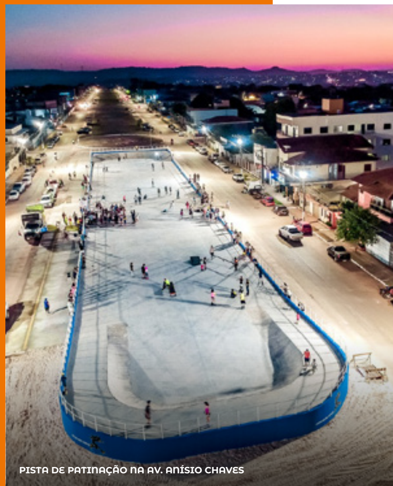
PISTA DE PATINAÇÃO NA AV. ANÍSIO CHAVES

Pela primeira vez na história, o distrito de Curuai , na Região do Lago Grande, recebeu asfalto. Foram mais de 1.290 metros de malha asfáltica , em vias como as Ruas José Lourido, Antônio Figueira e Henrique Canuto. Este projeto, avaliado em mais de R$ 3 milhões , incluiu não apenas a pavimentação, mas também a instalação de iluminação em LED, calçadas com piso tátil, meio-fio, sarjetas, drenagem superficial e sinalizações horizontal e vertical, por meio das placas e pinturas.