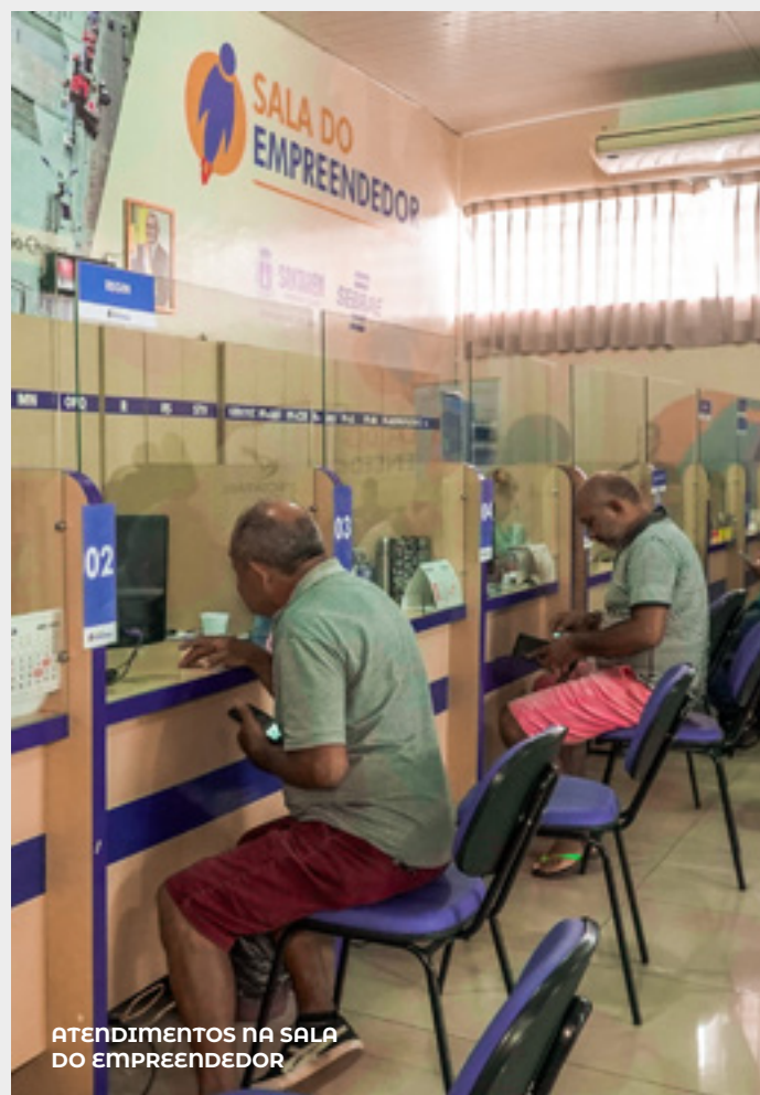
ATENDIMENTOS NA SALA DO EMPREENDEDOR

A Sala do Empreendedor , espaço dedicado à orientação sobre abertura, legalização e ampliação de empresas, desempenhou um papel fundamental na regularização e no aumento do número de empreendedores, especialmente dos Microempreendedores Individuais (MEI) . O município segue rigorosamente a Lei da Liberdade Econômica , facilitando o início de atividades