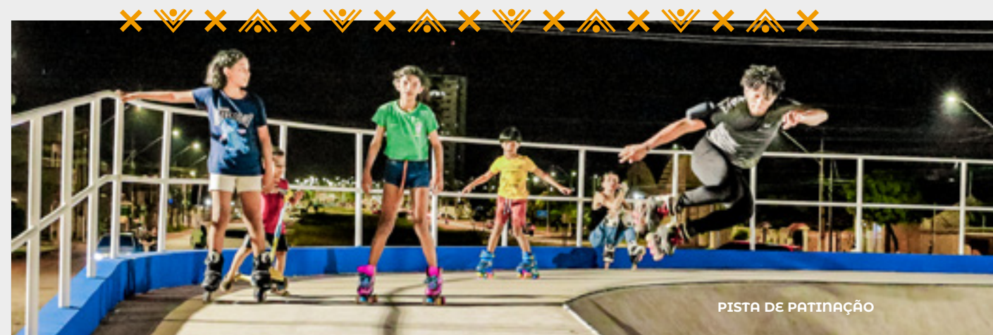
PISTA DE PATINAÇÃO

Em 2023, a Prefeitura de Santarém, por intermédio da Secretaria Municipal da Juventude, Esporte e Lazer (SEMJEL), esteve à frente de importantes eventos que atraíram públicos de todas as idades, desempenhando um papel ativo na realização e apoio de diversos torneios e campeonatos esportivos em parceria com associações de bairros e comunidades locais.