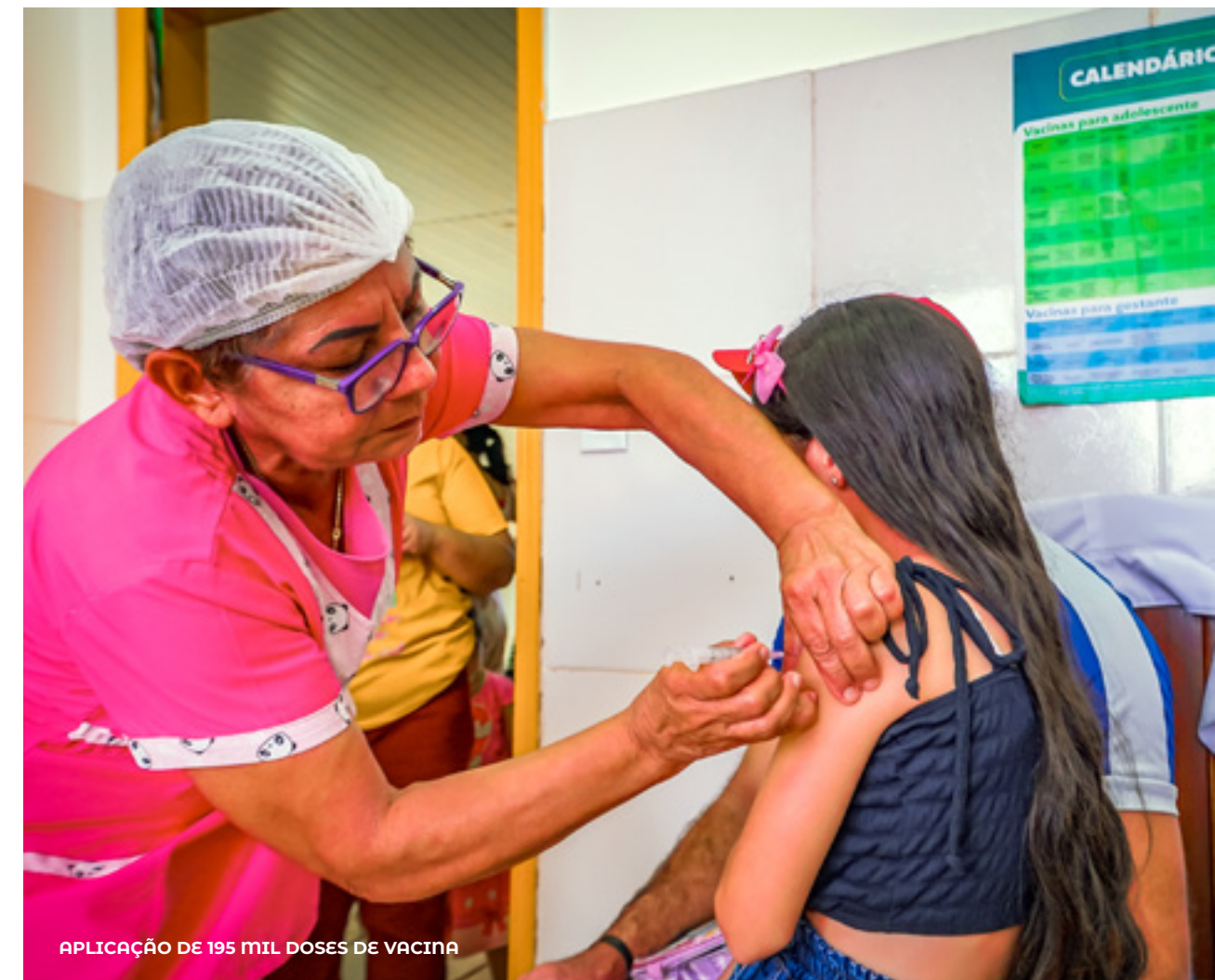
APLICAÇÃO DE 195 MIL DOSES DE VACINA

A Vigilância Animal , visando prevenir zoonoses, resgatou 123 animais em via pública, realizou 852 eutanásias e destinou 214 a novos lares. Também bateu recorde de vacinação antirrábica , imunizando mais de 35 mil pets.