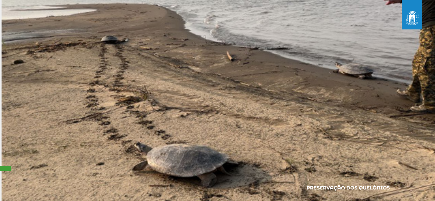
PRESERVAÇÃO DOS QUELÔNIOS

A SEMMA desempenhou papel crucial no combate aos focos de incêndio no município, adotando medidas de fiscalização, monitoramento e notificações . Em parceria com órgãos ambientais como a Polícia Militar , por meio da 1ª Companhia Independente de Policiamento Ambiental (1ª CipAmb) , Corpo de Bombeiros , ICMBio e ZooUnama , a equipe promoveu a devolução de dezenas de animais silvestres à natureza .