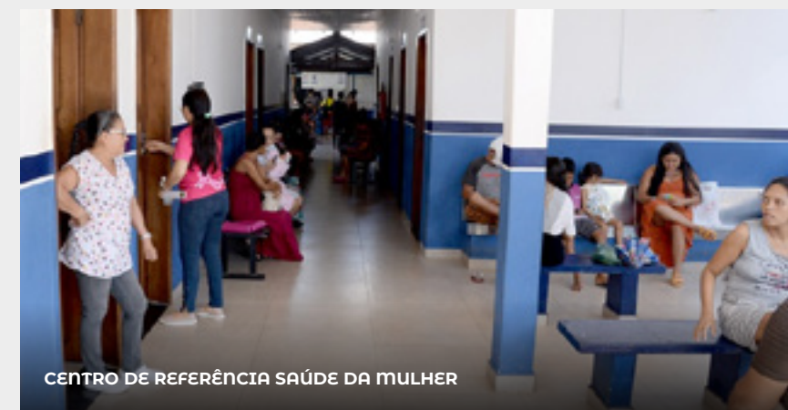
CENTRO DE REFERÊNCIA SAÚDE DA MULHER