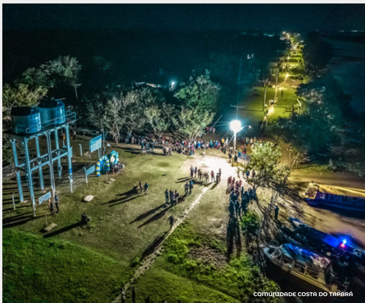
COMUNIDADE COSTA DO TAPARÁ

A ação se estendeu à comunidade Costa do Tapará , na região de várzea, beneficiando 1200 famílias com a chegada da iluminação pública.