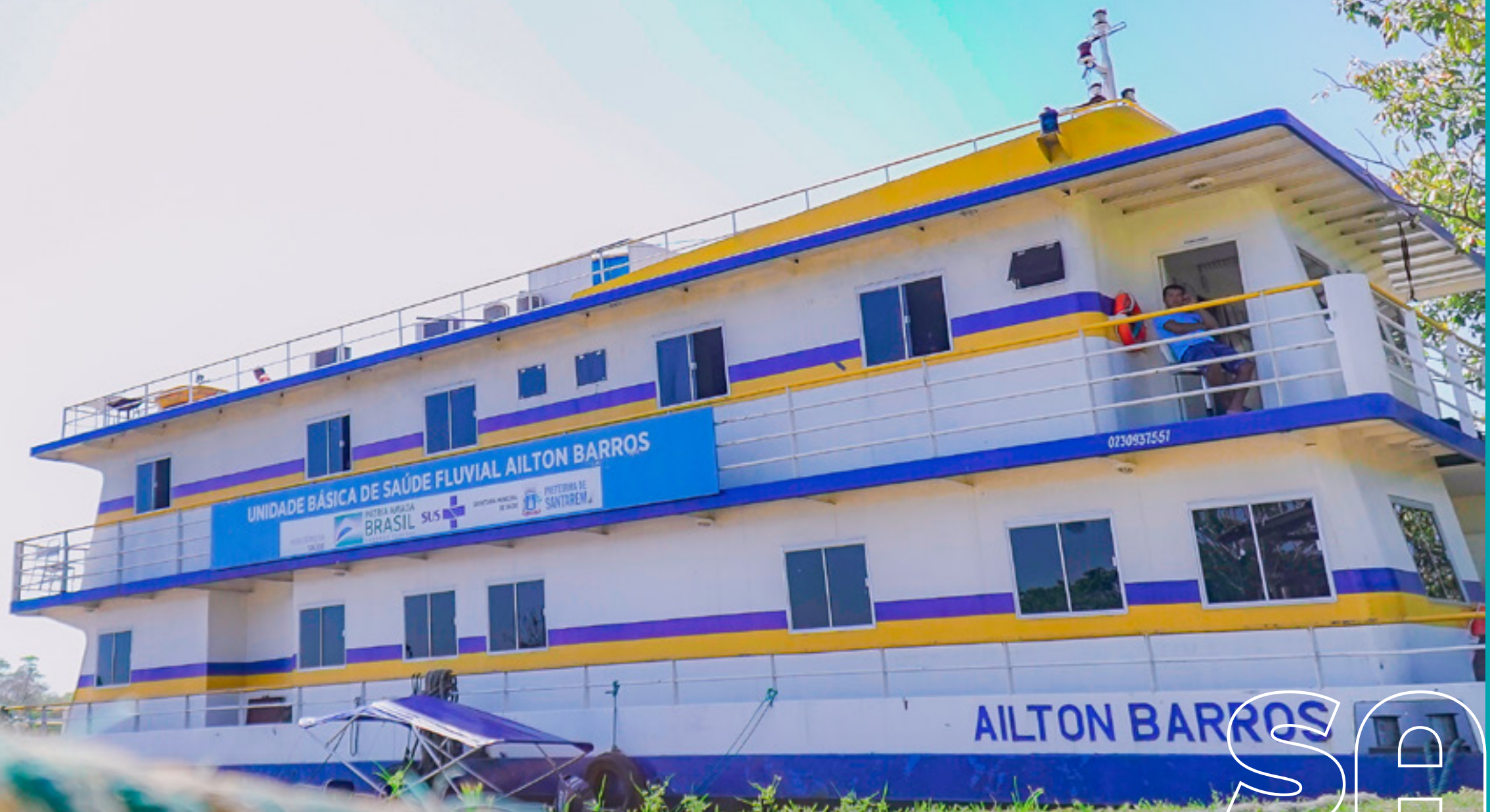
UBS FLUVIAL AILTON BARROS