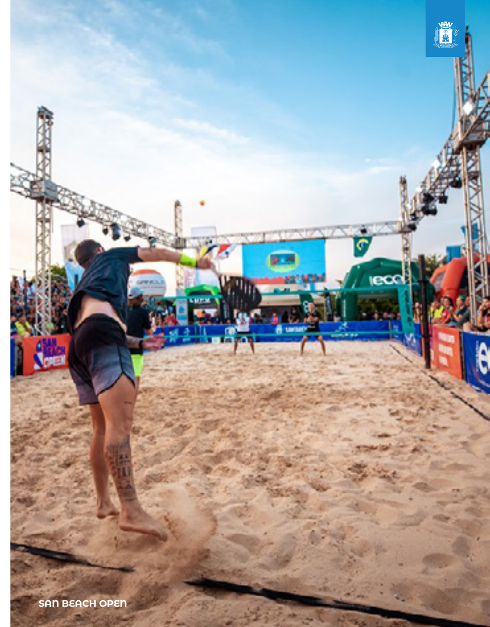
SAN BEACH OPEN