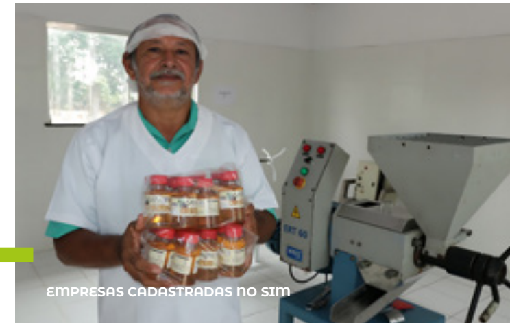
EMPRESAS CADASTRADAS NO SIM

Outra importante obra na área de infraestrutura rural foi a construção da nova ponte de madeira no ramal de acesso às comunidades Vila Nova e São Braz , na região do Eixo Forte. Essa obra oferece melhorias significativas para o transporte escolar, agricultura familiar e turismo, contribuindo para a mobilidade e o conforto na região.