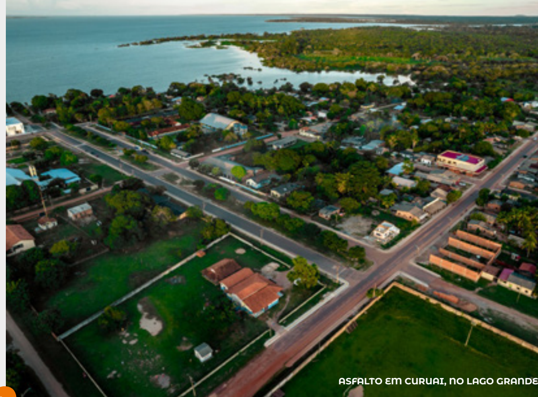
ASFALTO EM CURUAI, NO LAGO GRANDE