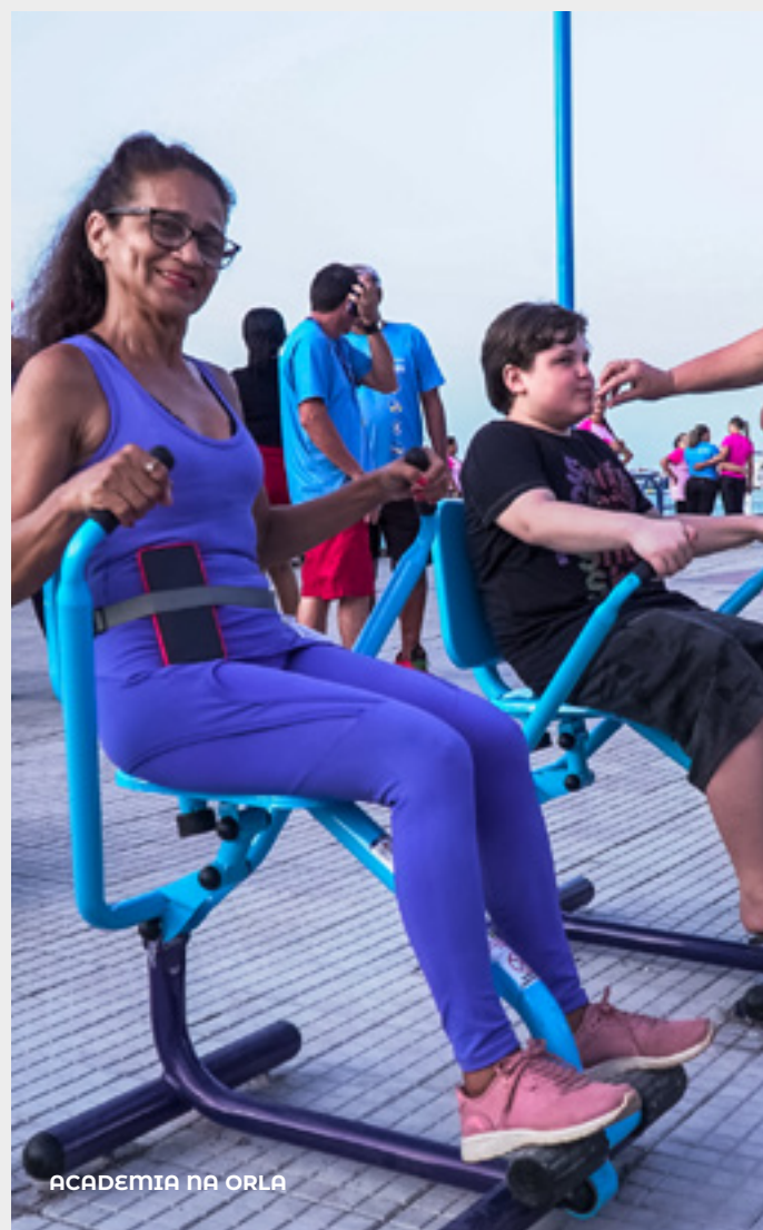
ACADEMIA NA ORLA

Programações que incluíram treinamento funcional e atendimentos de saúde, estabelecendo parcerias com instituições públicas e privadas para oferecer serviços voltados ao bem-estar da população.