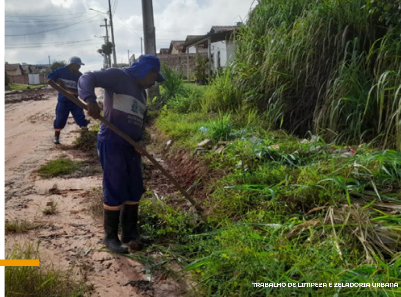
TRABALHO DE LIMPEZA E ZELADORIA URBANA

Em 2023, foram expedidas 380 licenças para eventos em espaços públicos e cadastrados 168 vendedores ambulantes .