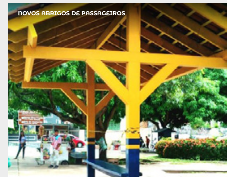
NOVOS ABRIGOS DE PASSAGEIROS

instaladas para garantir eficácia, informando aos usuários sobre a existência de perigos e sua natureza.