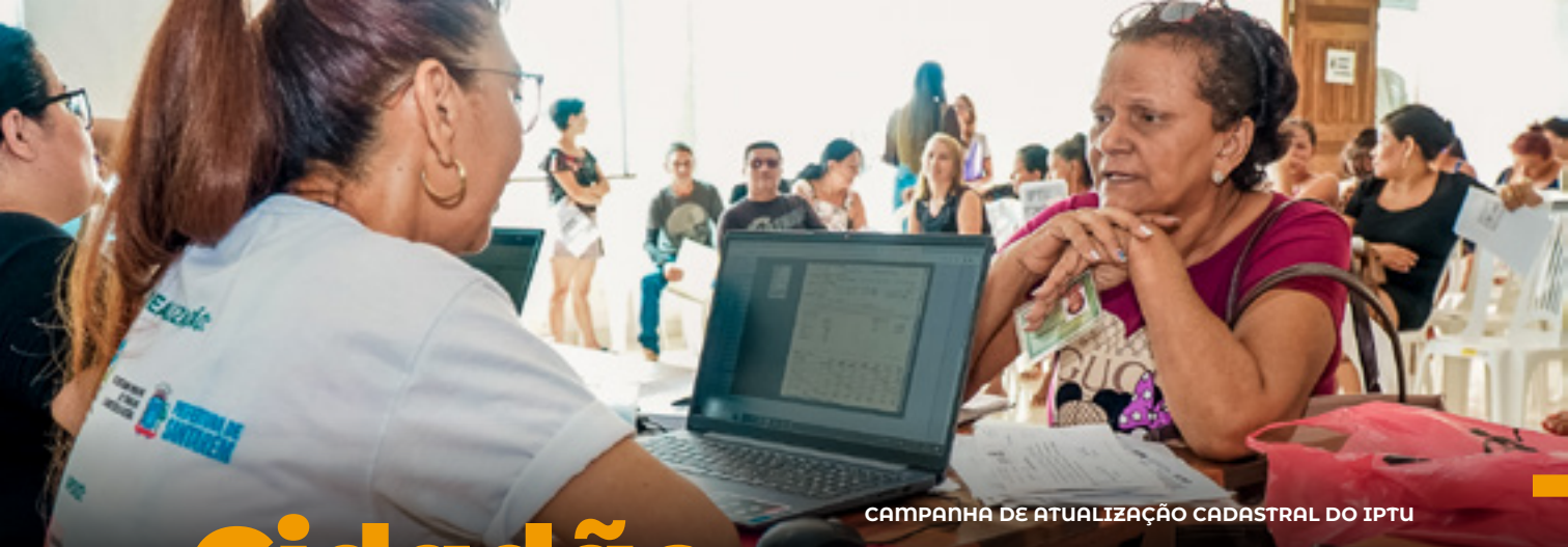
CAMPANHA DE ATUALIZAÇÃO CADASTRAL DO IPTU