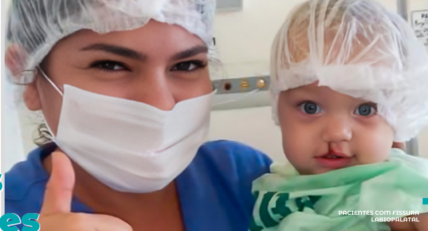
PACIENTES COM FISSURA LABIOPALATAL

Em 2023, a saúde pública de Santarém experimentou notáveis avanços, impulsionados por investimentos em equipamentos e infraestrutura . Foram adquiridos mais de 400 equipamentos para os três níveis de atenção à saúde , além de materiais permanentes . A frota de veículos foi ampliada com dois carros e uma ambulância, e 17 Unidades Básicas de Saúde foram revitalizadas , juntamente com três centros especializados : o de referência em saúde da mulher, o de Atenção Psicossocial de Álcool e Outras Drogas (CAPS AD III) e o de Especialidades Odontológicas (CEO Maracanã). Essas melhorias resultaram em um aumento significativo na capacidade de atendimento à população.