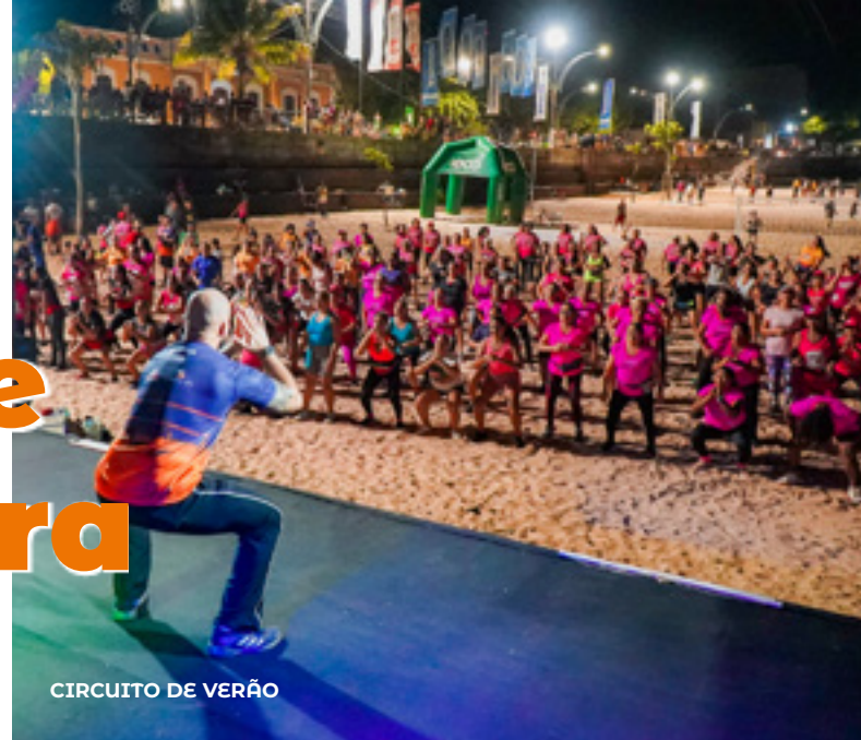
CIRCUITO DE VERÃO