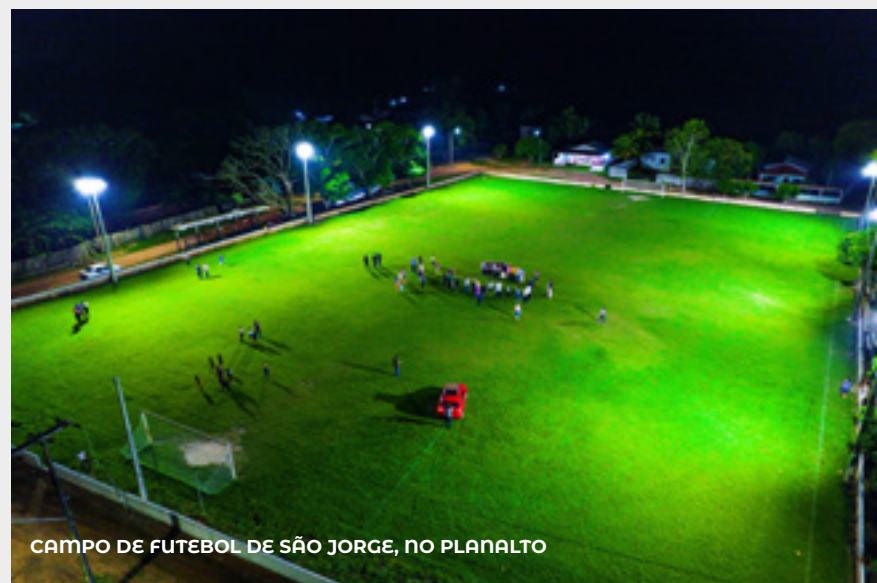
CAMPO DE FUTEBOL DE SÃO JORGE, NO PLANALTO