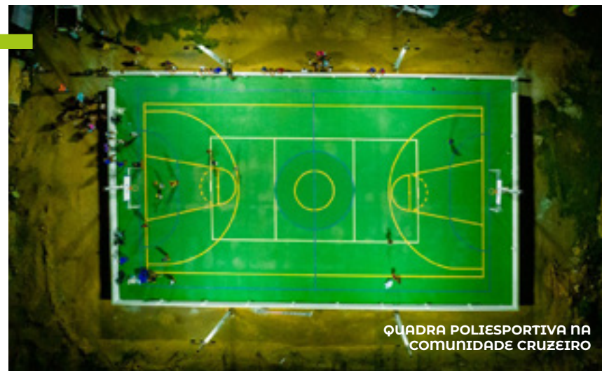
QUADRA POLIESPORTIVA NA COMUNIDADE CRUZEIRO