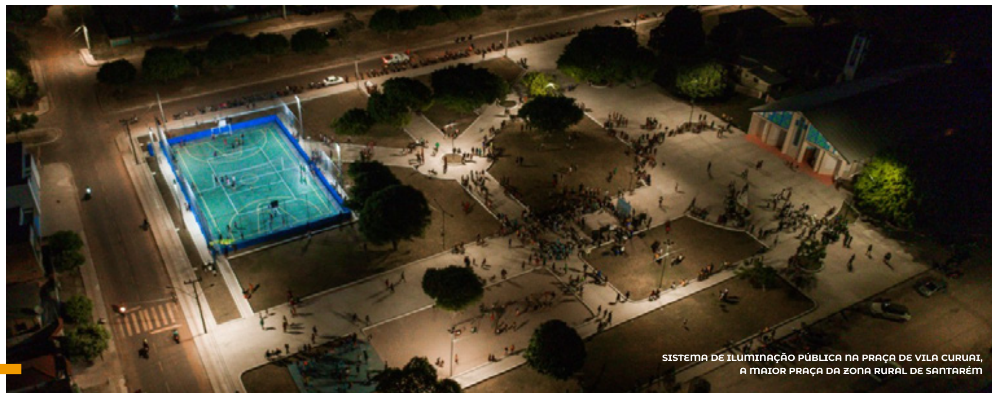
SISTEMA DE ILUMINAÇÃO PÚBLICA NA PRAÇA DE VILA CURUAI, A MAIOR PRAÇA DA ZONA RURAL DE SANTARÉM