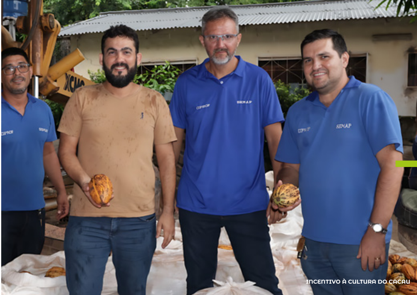
INCENTIVO À CULTURA DO CACAU

Na região do Lago Grande , a comunidade Piraquara recebeu a tão sonhada ponte de madeira . Com 440 metros de comprimento e 2 metros de largura, equipada com iluminação de LED , a iniciativa representou um investimento de R$ 1.059.832,5 . Essa ponte beneficiou diretamente cerca de 13 comunidades do Alto Lago , proporcionando qualidade de vida, mobilidade e conforto.