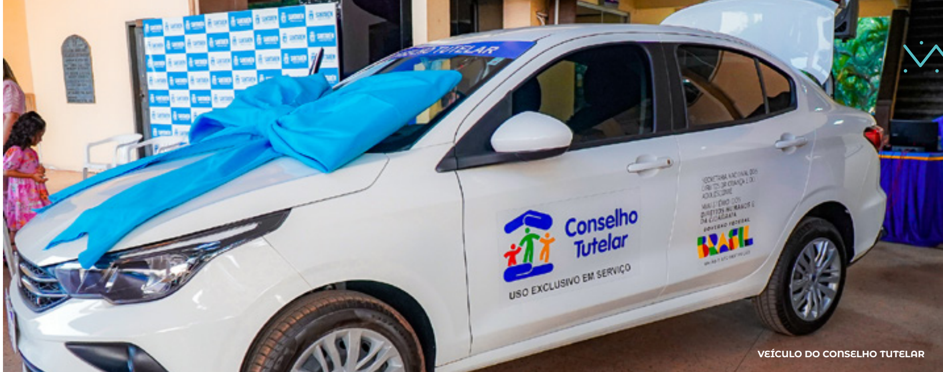
VEÍCULO DO CONSELHO TUTELAR