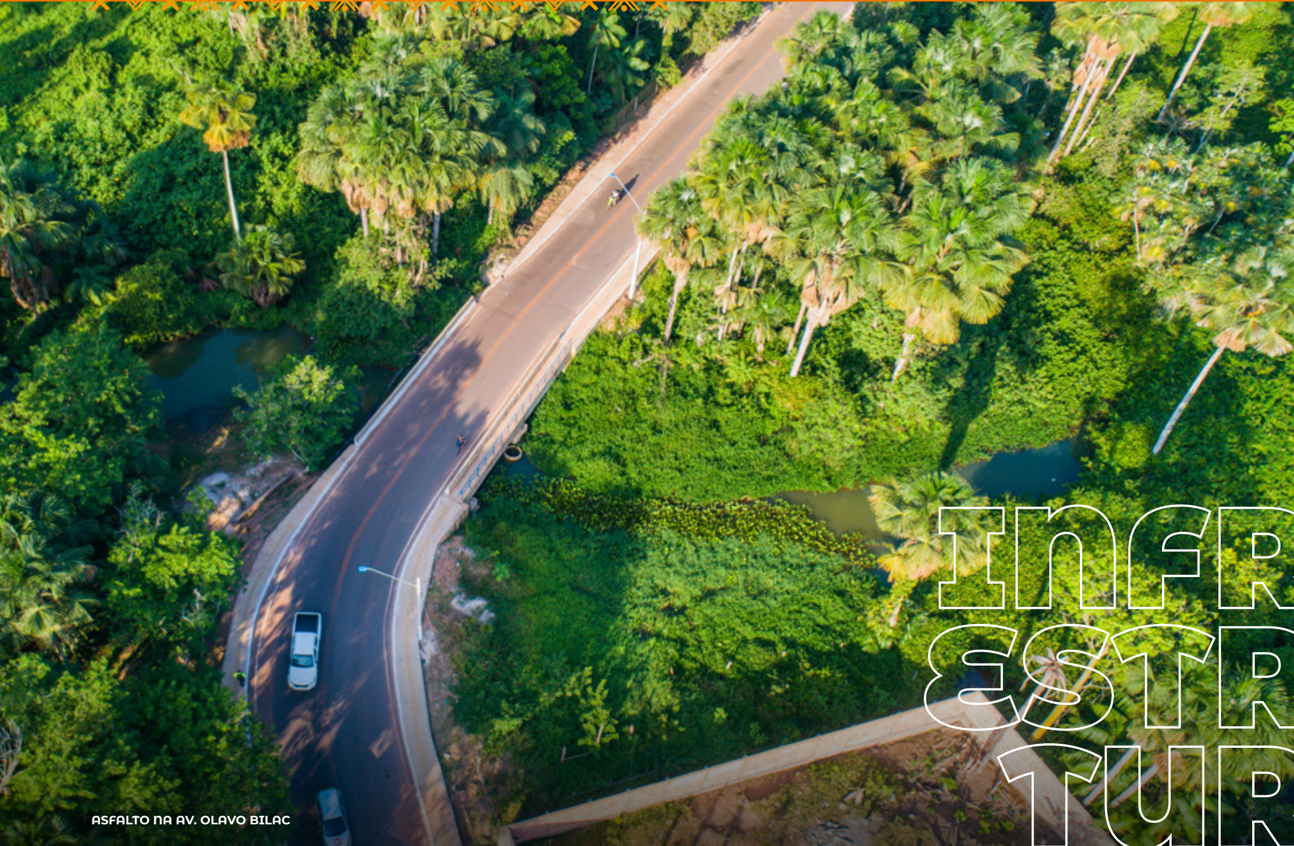
ASFALTO NA AV. OLAVO BILAC