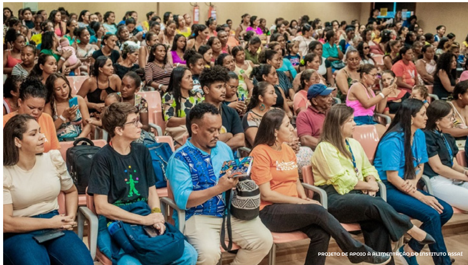
PROJETO DE APOIO À ALIMENTAÇÃO DO INSTITUTO ASSAÍ