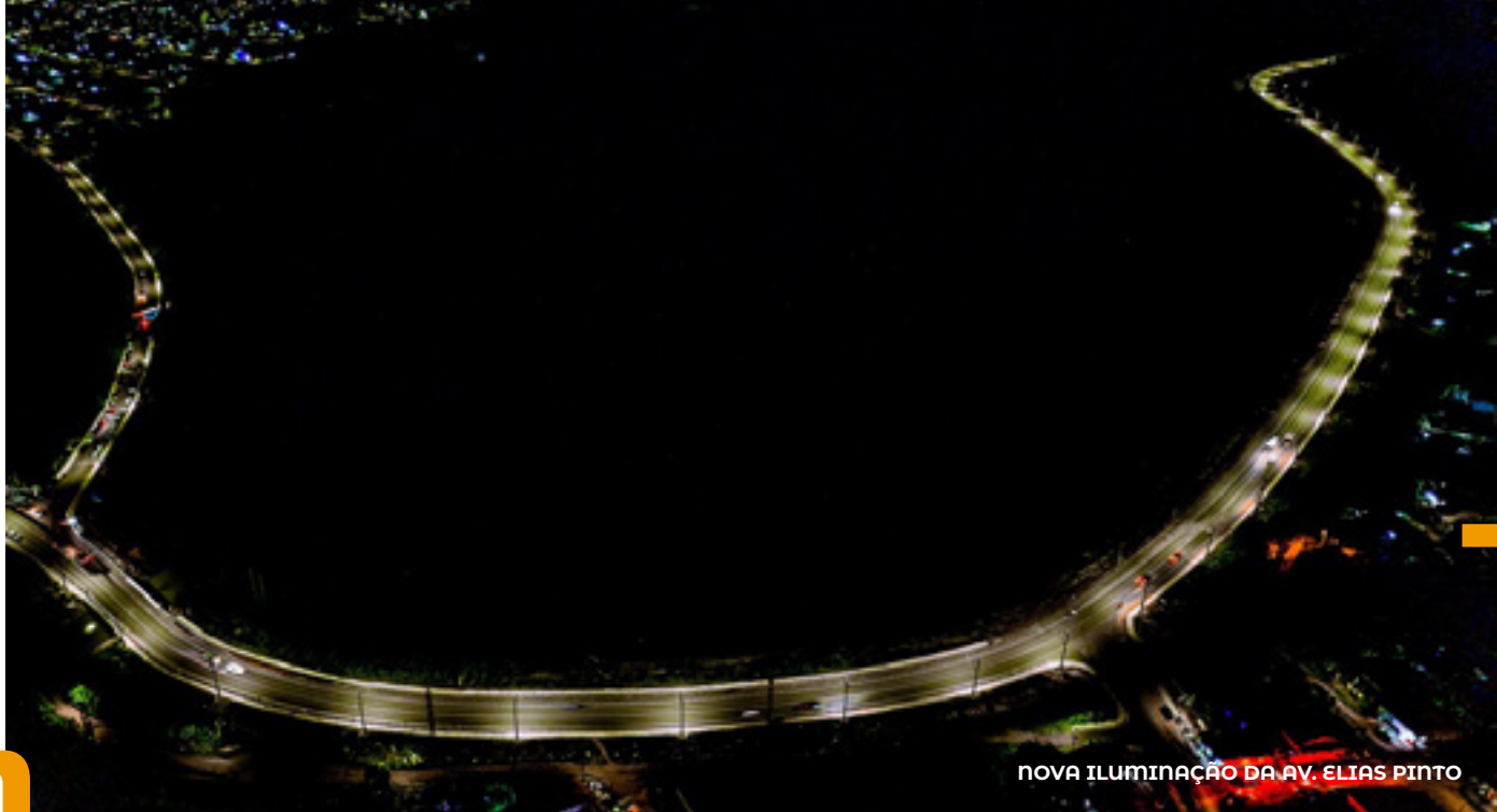
NOVA ILUMINAÇÃO DA AV. ELIAS PINTO