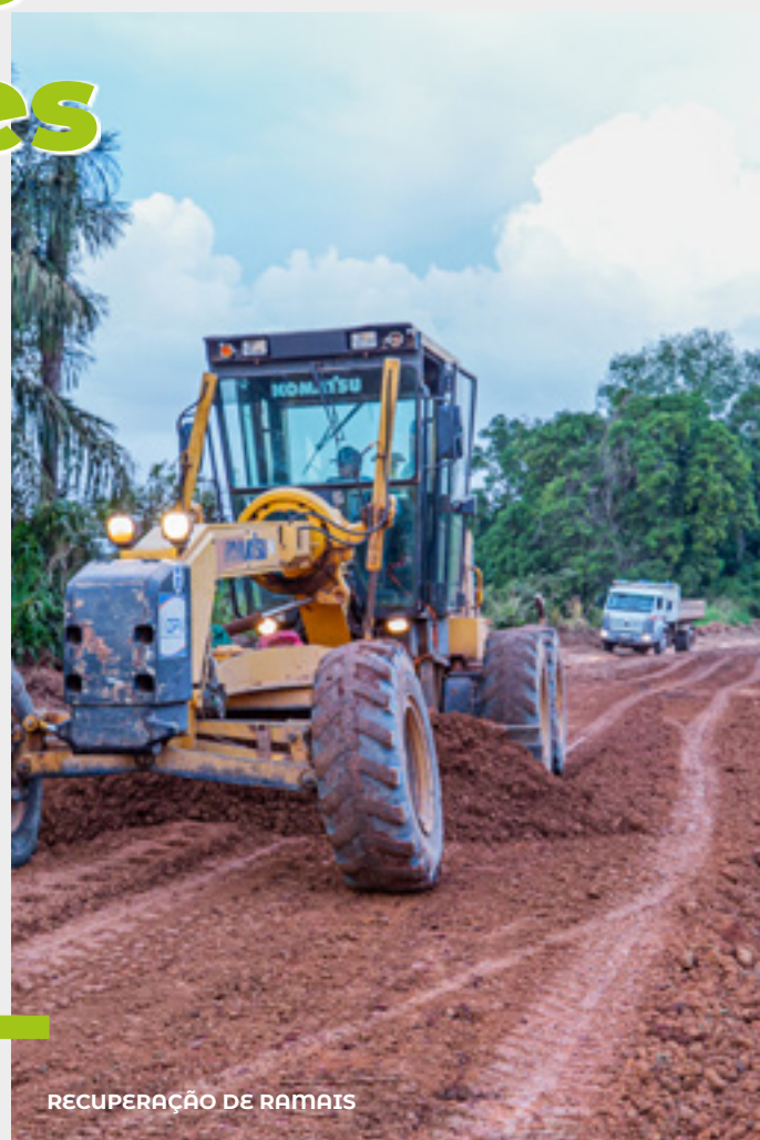
RECUPERAÇÃO DE RAMAIS

Com recursos próprios, foram recuperados 280 km de ramais , abrangendo 1.500 km da malha viária do município . Os serviços alcançaram as regiões do Lago Grande, Eixo Forte, Ituqui, Curuá-Una, Corta Corda e Planalto (BR 163), atendendo cerca de 70 comunidades nessas áreas rurais, das 385 existentes.