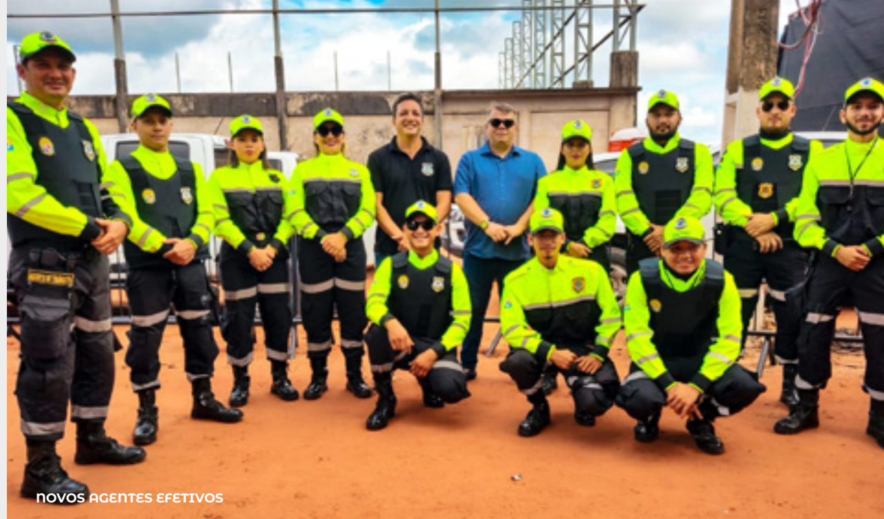
NOVOS AGENTES EFETIVOS

No decorrer de 2023, foram realizadas 1.837 operações de fiscalização , abrangendo ações repressivas, educativas e rotineiras. A equipe responsável pelo Boletim de