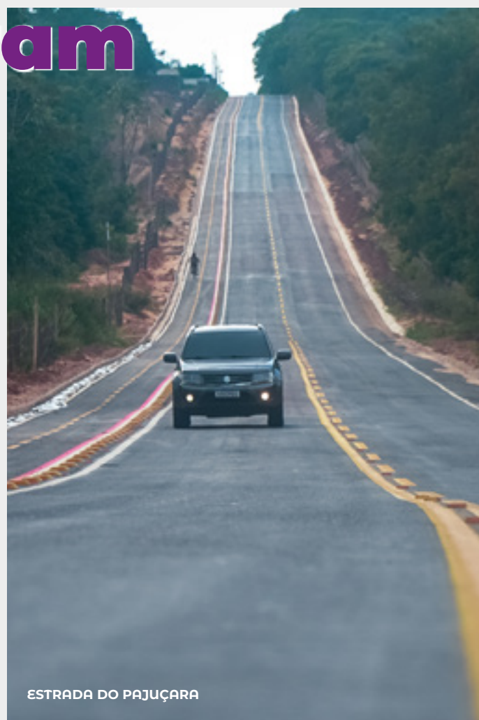
ESTRADA DO PAJUÇARA

Santarém marcou presença na 11ª edição da Feira Internacional de Turismo da Amazônia (FITA) , em Belém, considerada a maior feira de turismo da região Norte. E também participou da World Travel Market , a maior feira de turismo da América Latina.