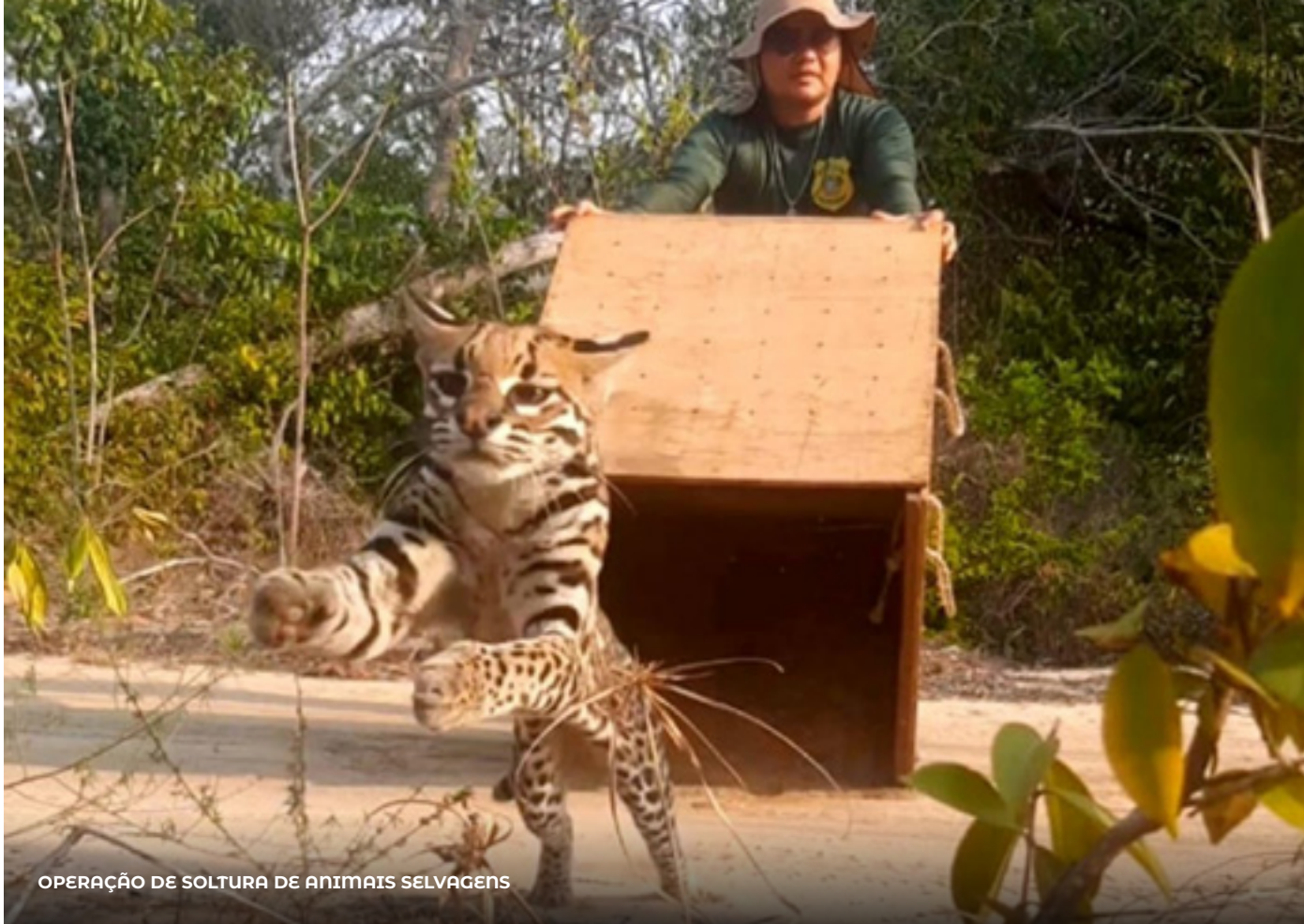
OPERAÇÃO DE SOLTURA DE ANIMAIS SELVAGENS

O setor de monitoramento tem realizado um trabalho específico, voltado à caracterização do igarapé do Urumari e, posteriormente, Irurá , com o objetivo de levantar