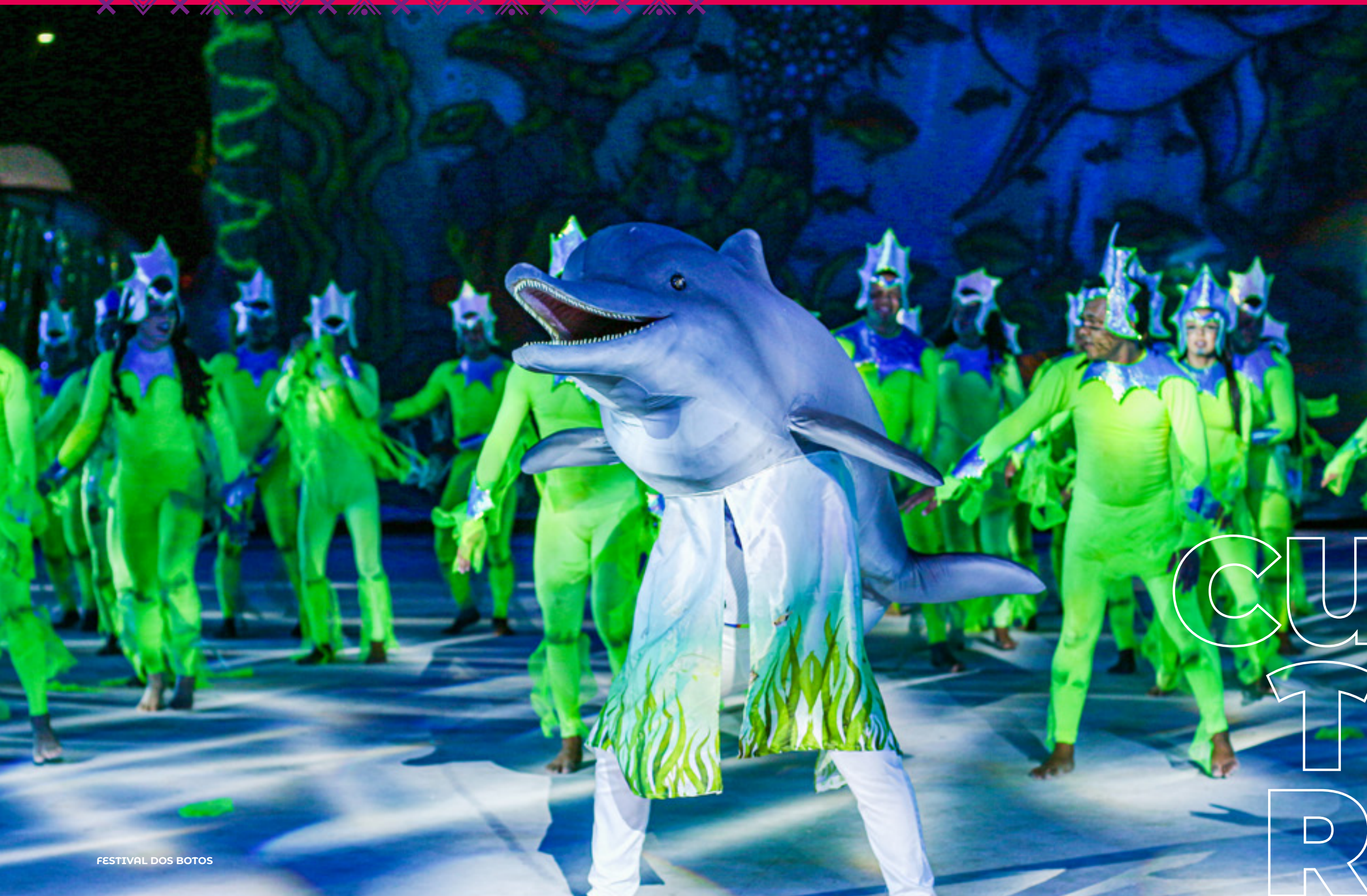
FESTIVAL DOS BOTOS